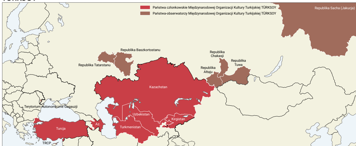
Mapa 2. Państwa członkowskie i obserwatorzy Międzynarodowej Organizacji Kultury Turekijskiej TÜRKSOY